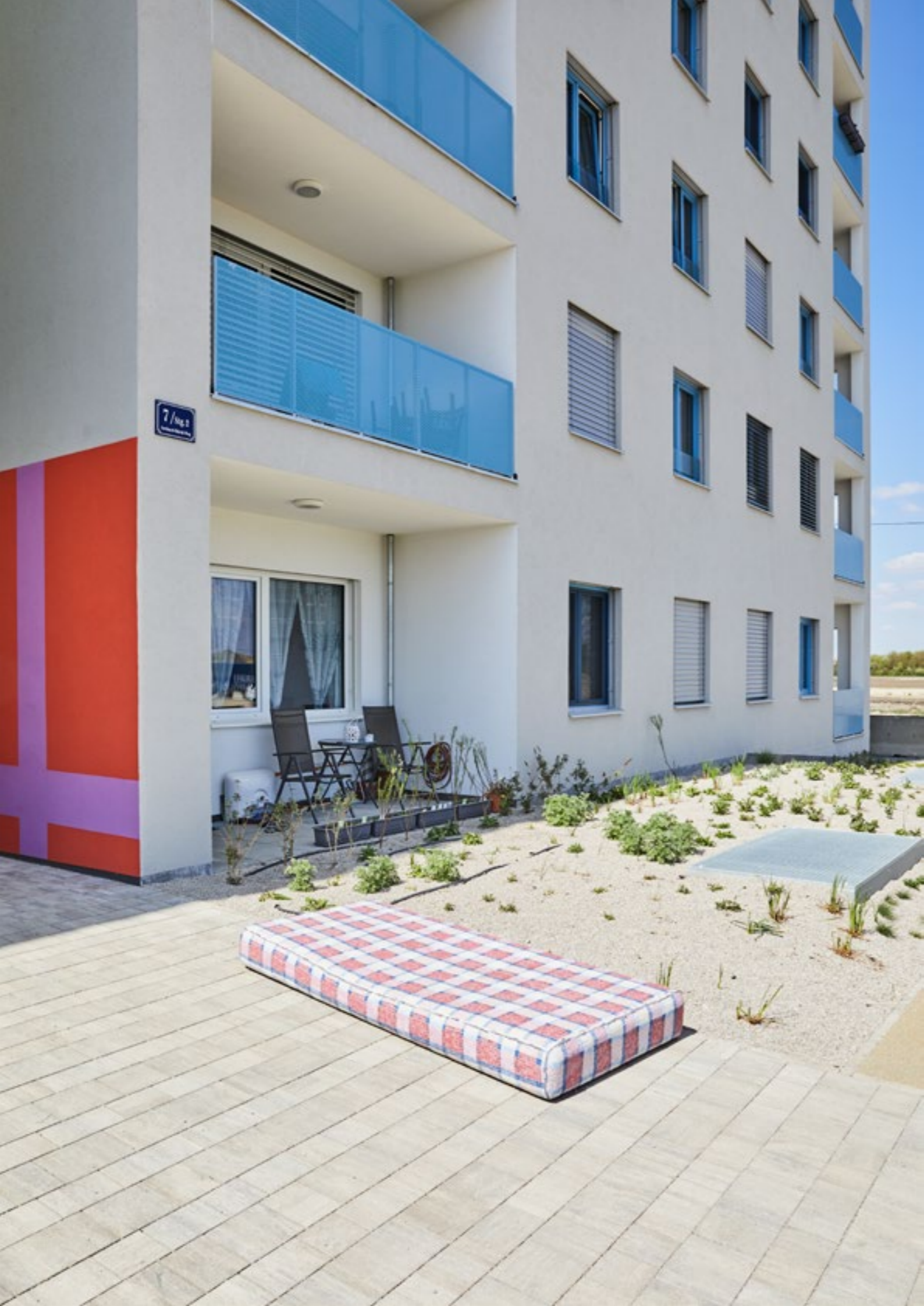
Matratze, 2022, Beton, Mosaikglas