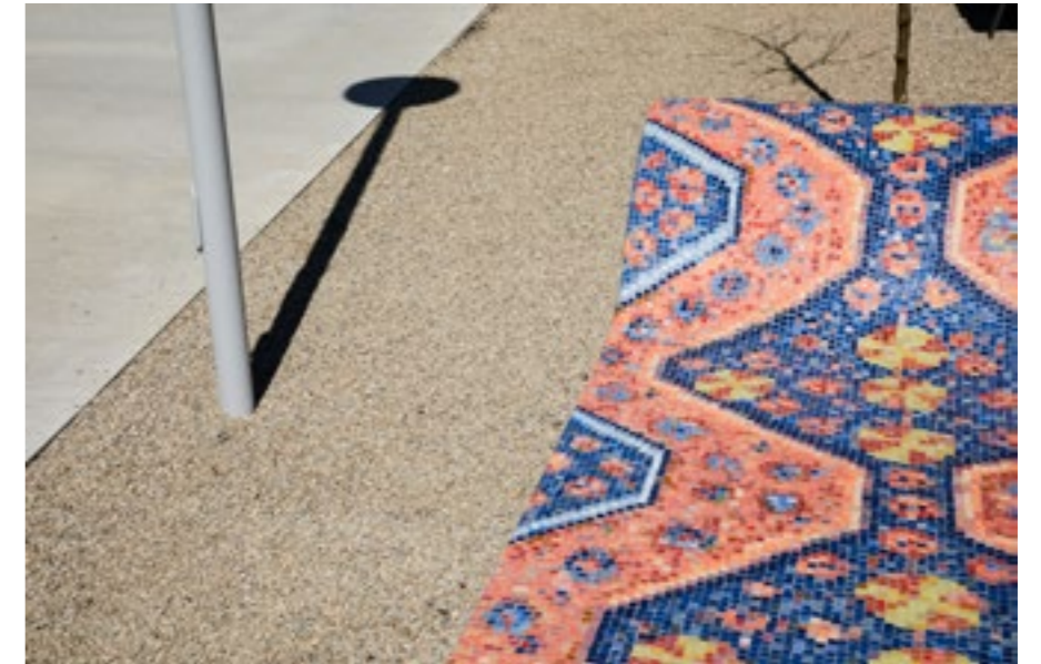
Freuds Couch, 2022, Beton, Mosaikglas