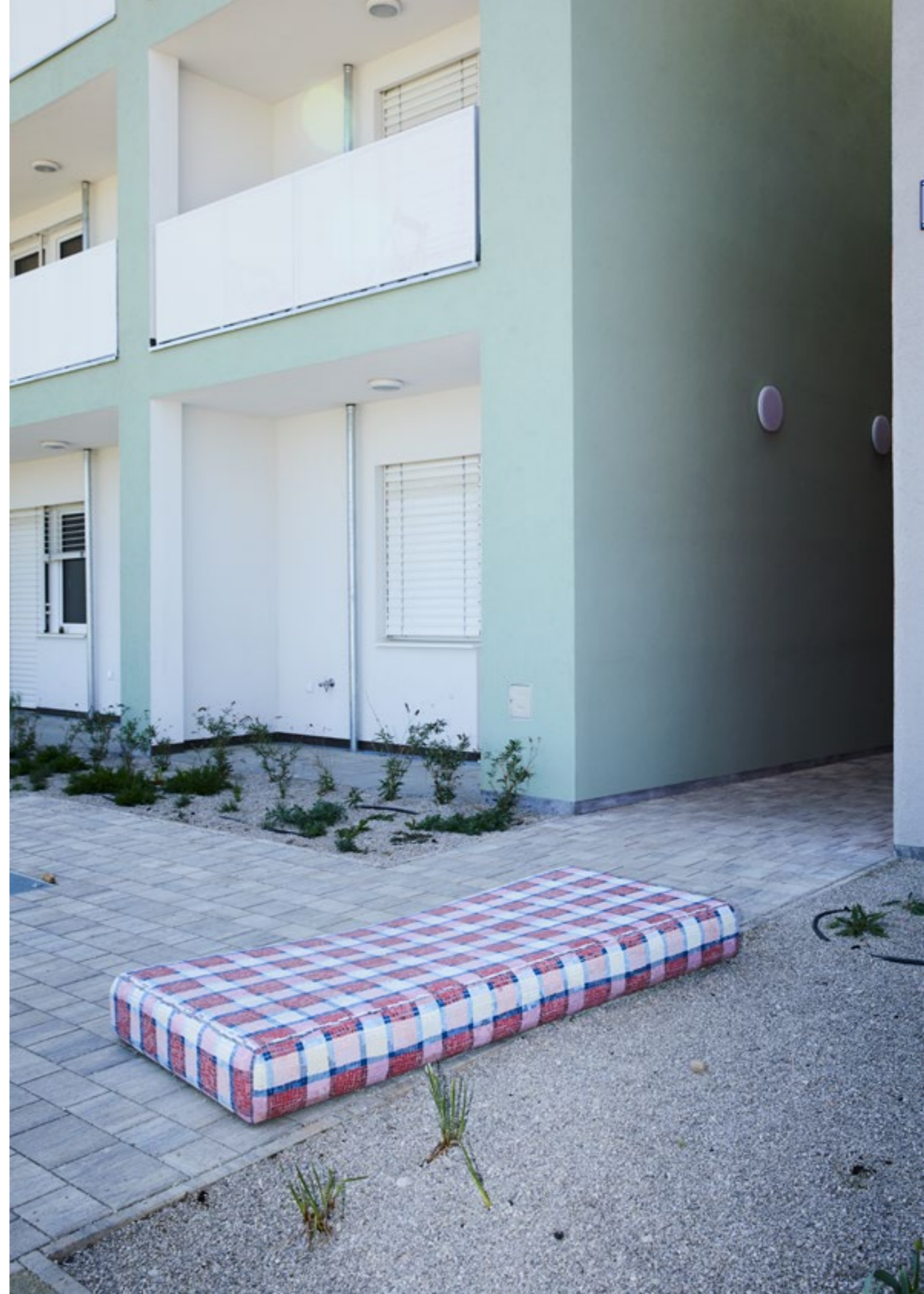
Matratze, 2022, Beton, Mosaikglas