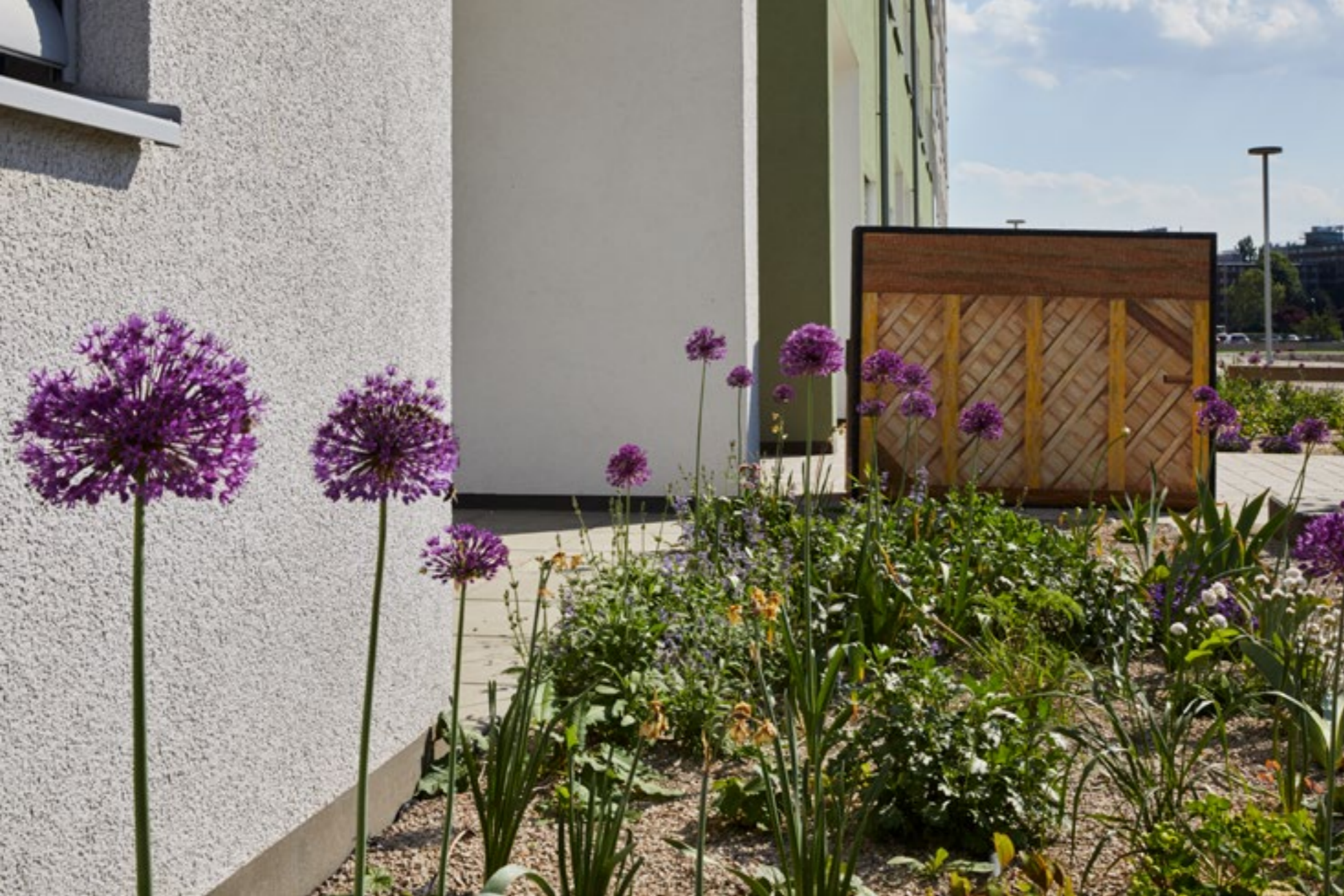
Klavier; 2022, Beton, Mosaikglas