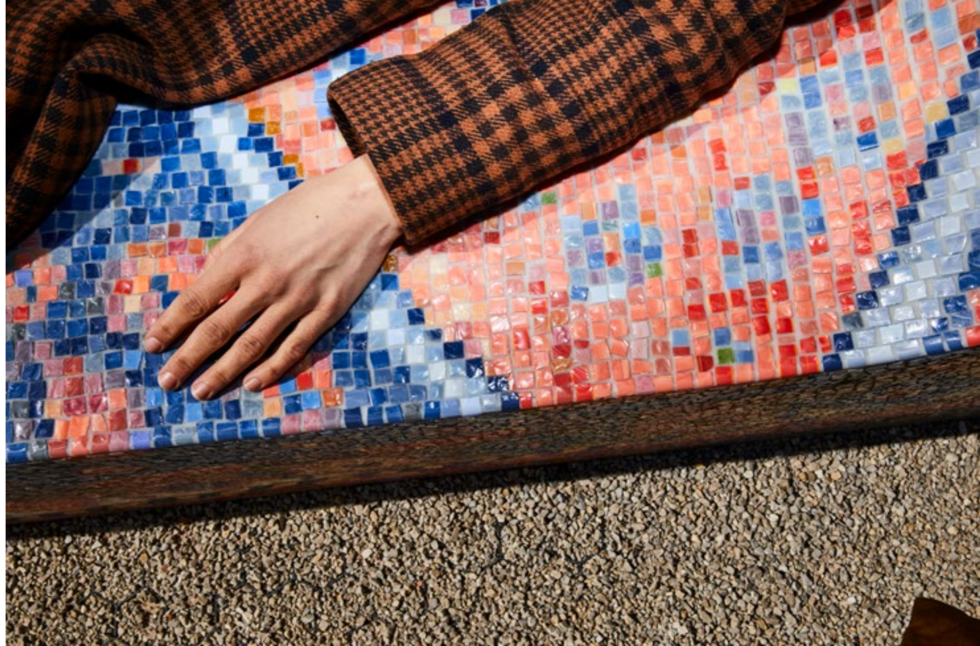
← diese und vorige Doppelseite: Freuds Couch , 2022, Beton, Mosaikglas