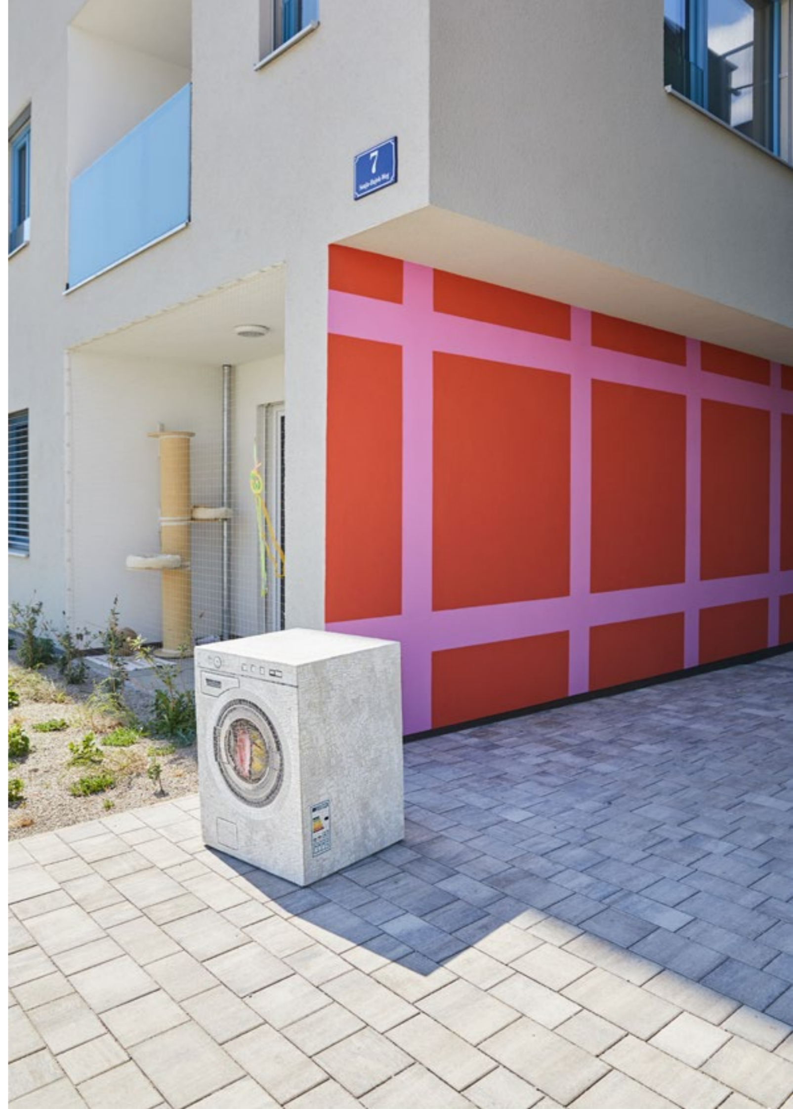
← diese und vorige Doppelseite: Waschmaschine , 2022, Beton, Mosaikglas